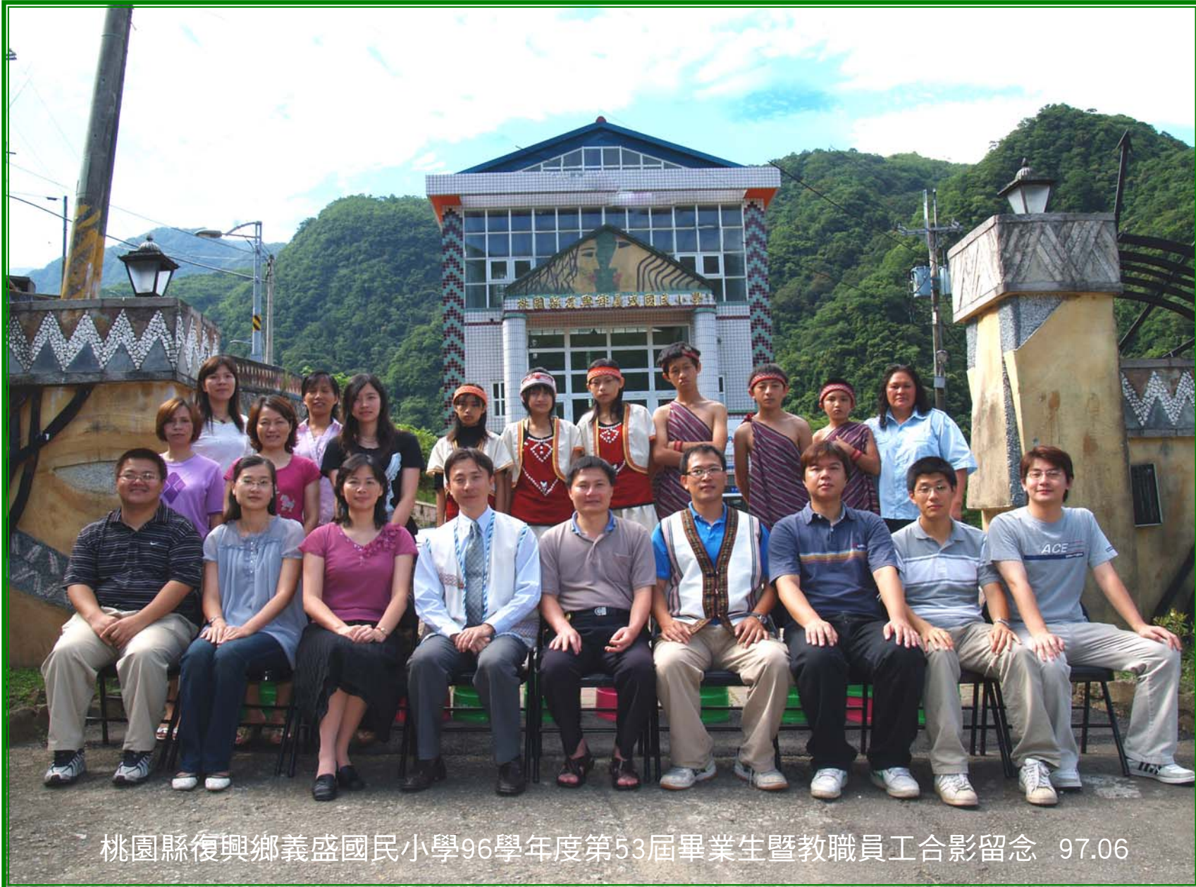
桃園縣復興鄉義盛國民小學96學年度第53屆畢業生暨教職員工合影留念 97.06