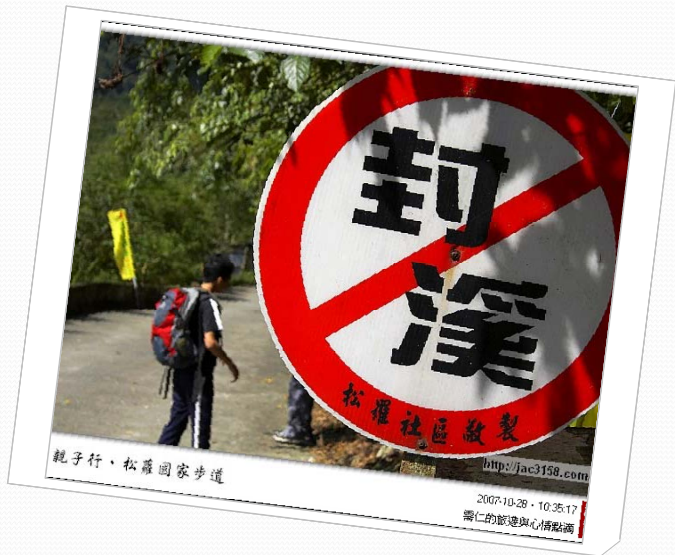
親子行·松羅國家步道